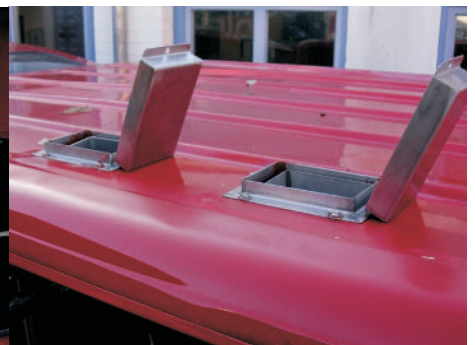
Abgasführung im Fahrzeugdach